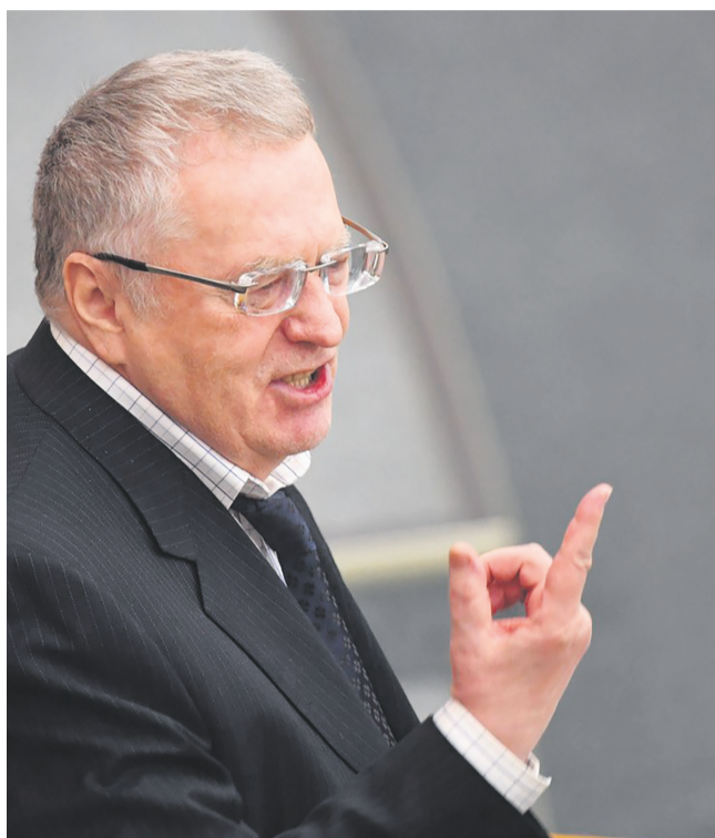
Владимир Жириновский. Госдума РФ.