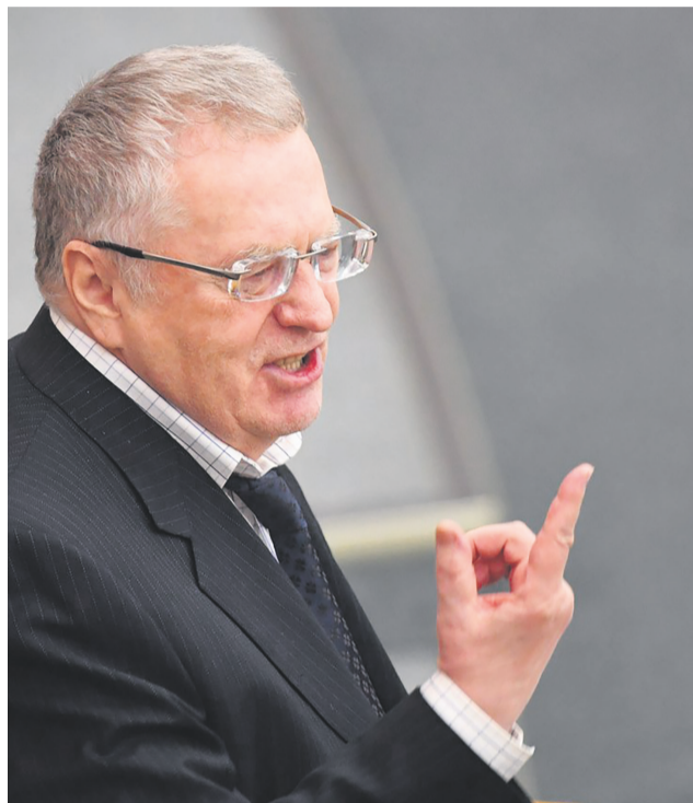
Владимир Жириновский. Госдума РФ.

Минфин внёс на рассмотрение Госдумы законопроект, меняющий подход к налогообложению богатых россиян. По замыслу разработчиков, состоятельные коммерсанты, которые провели в России 90 дней в году и больше, будут обязаны платить налоги именно в нашей стране, а не искать государство, где сборы в разы меньше. Кроме того, Минфин намерен использовать так называемый глобальный подход, когда налог будет браться со всех доходов богача, заработанных им как в стране резидентства, так и за её границами, а также сделать одинаковой ставку НДФЛ для налоговых резидентов и нерезидентов на уровне 13%. Как считают авторы инициативы, это позволит существенно увеличить налоговые сборы в России.